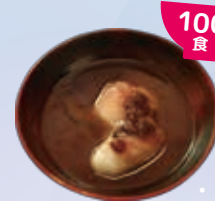
おしるこ produced by 新鶴