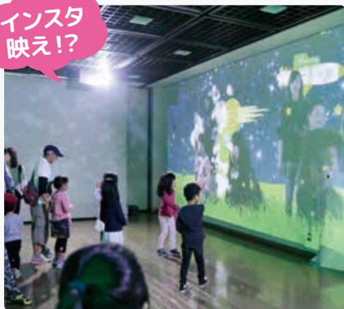
※掲載画像と実際の演出内容は異なります