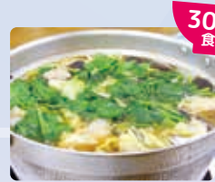
特製ちゃんこ鍋 荒汐部屋