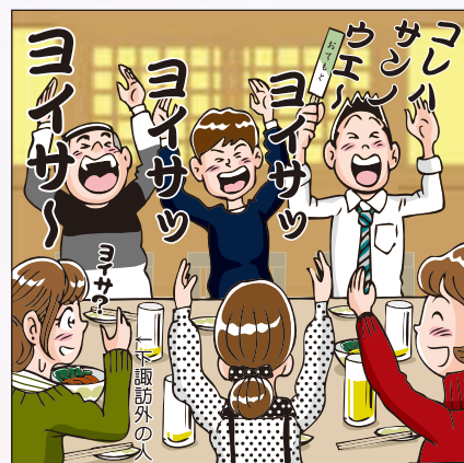
(例)宴会のしめは木遣り